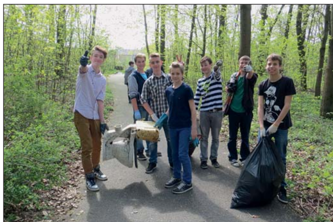
ZŠ – Den Země (str. 5)