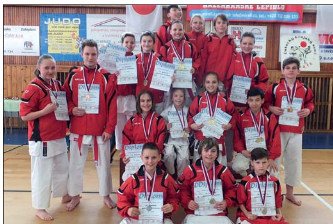
SK Karate Dragon (str. 14)