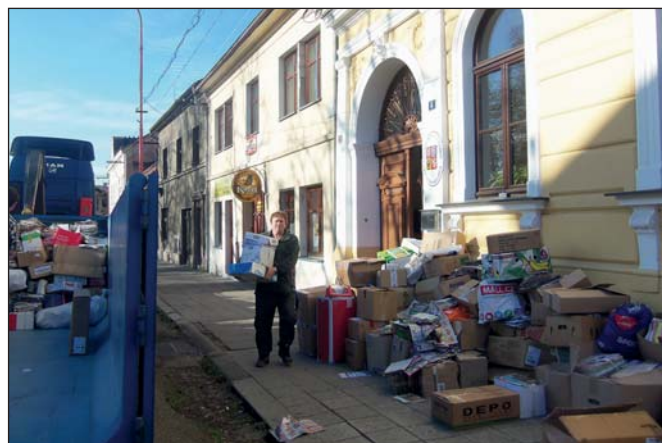
ZŠ – Sběr papíru (str. 4)