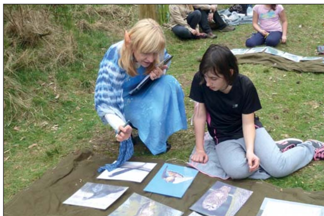
Skautky – Druhý dívčí oddíl (str. 10)