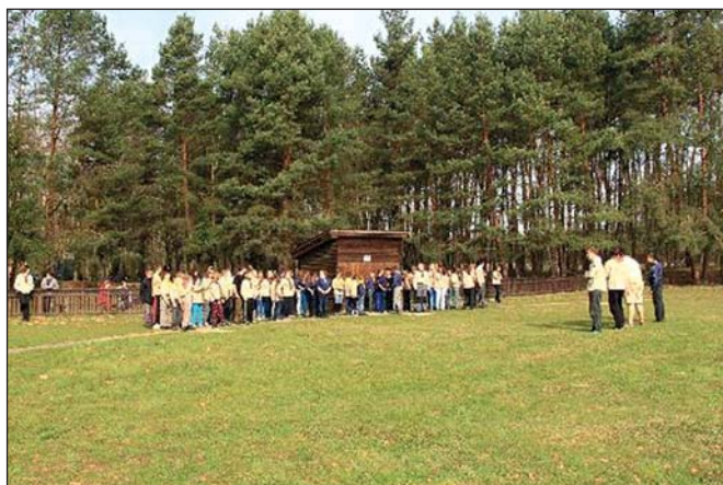
Skautky – Druhý dívčí oddíl (str. 10)