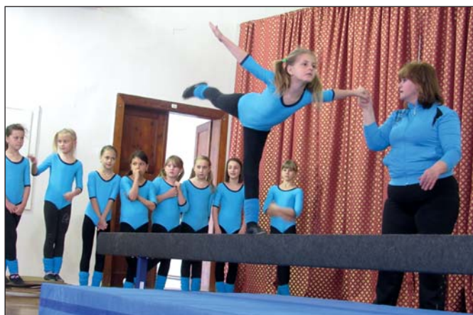
SOKOL – gymnastické závody všestrannosti (str. 14)