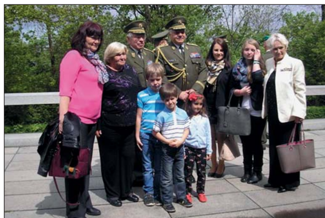
MŠ Stonožka (str. 8)