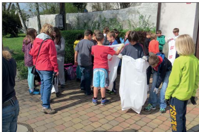
ZŠ – Den Země (str. 5)