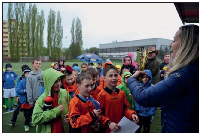
ZŠ – Fotbalový turnaj (str. 6)