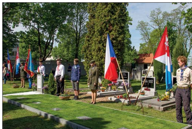
Ohlédnutí za oslavou – Kladení věnců (str. 1)