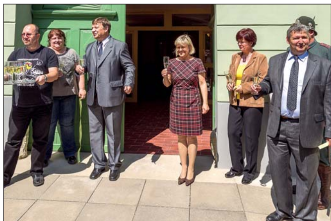
Ohlédnutí za oslavou – Slavnostní otevření infocentra (str. 1)