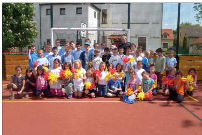
ŠD – Fotbal v Zárybech (str. 8)