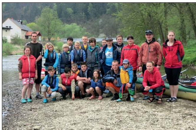
Vodáci – Sázava (str. 9)