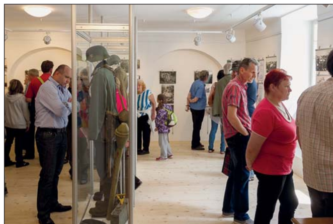
Ohlédnutí za oslavou – Vernisáž výstavy (str. 1)