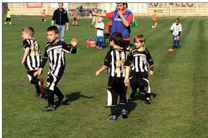
SK Labský Kostelec – přípravky (str. 12)