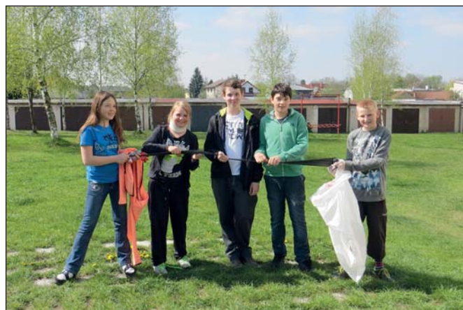
ZŠ – Den Země (str. 5)