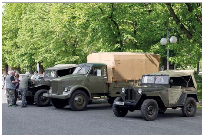
Ohlédnutí za oslavou – Vojenská technika (str. 1)