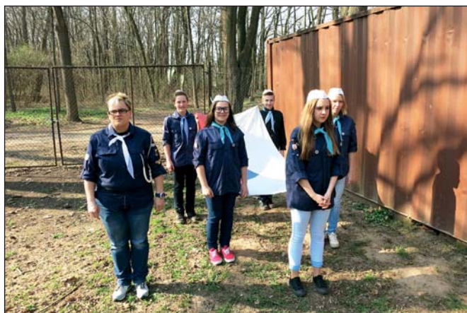
Vodáci – Odemykání Labe (str. 9)