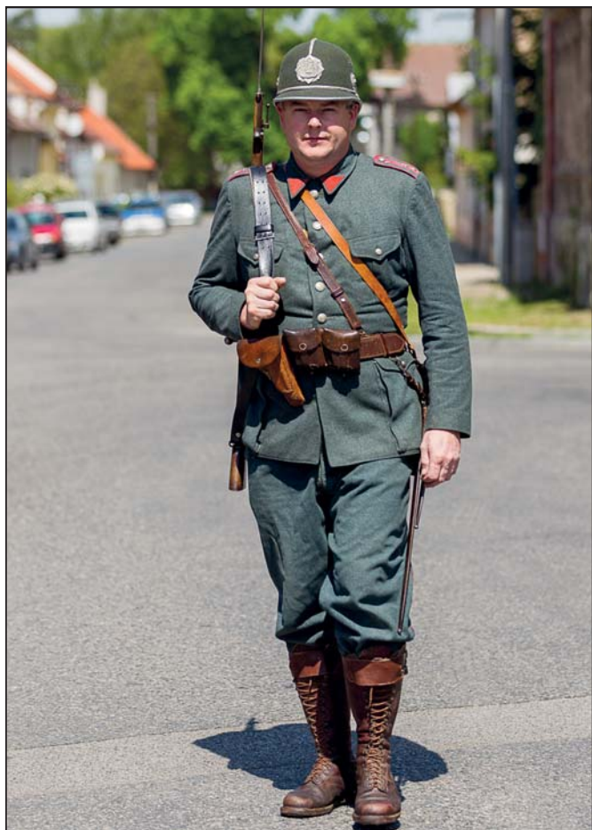
Ohlédnutí za oslavou – Četník z roku 1945 (str. 1)