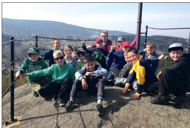
Vodáci – Pulci ve Smržovce (str. 9)