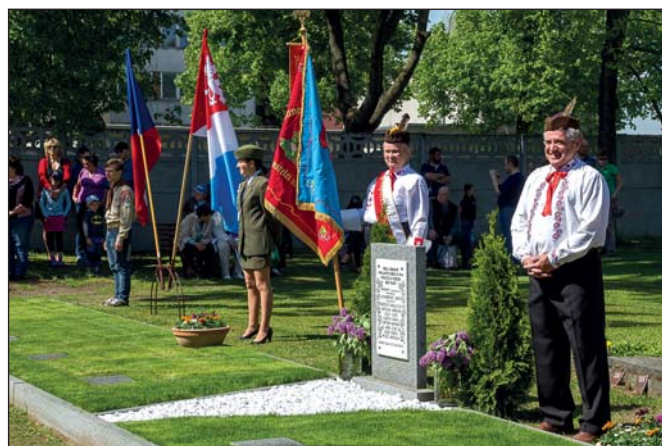
Ohlédnutí za oslavou – Kladení věnců (str. 1)