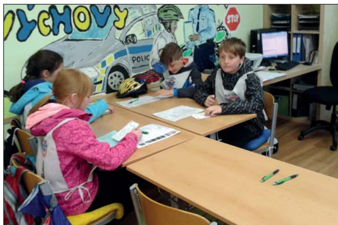
ZŠ – Dopravní soutěž (str. 5)